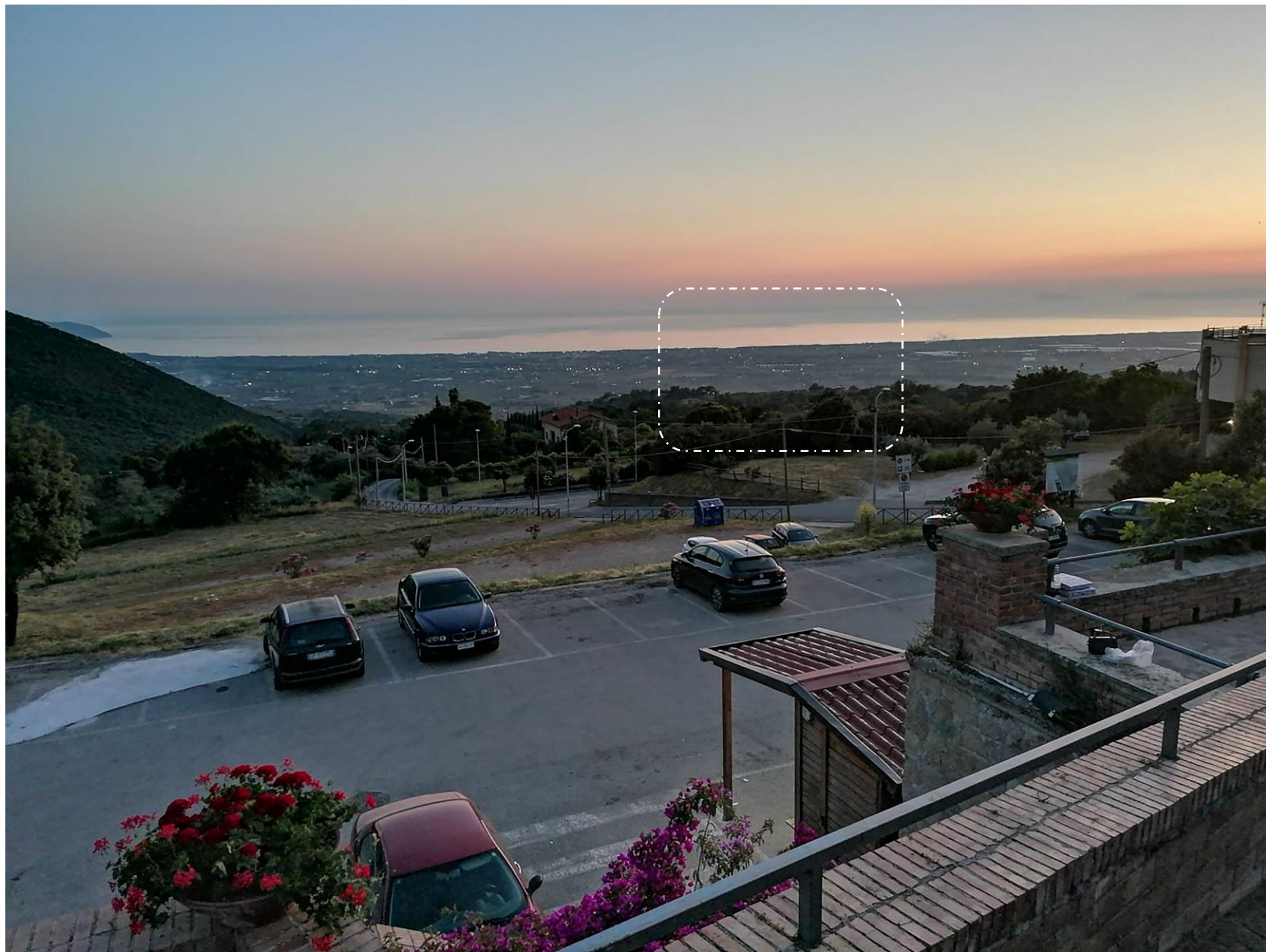
Foto 8: Vista dai giardini di Piazza Tempone di Capaccio Capoluogo (foto-inserimento stato di progetto)