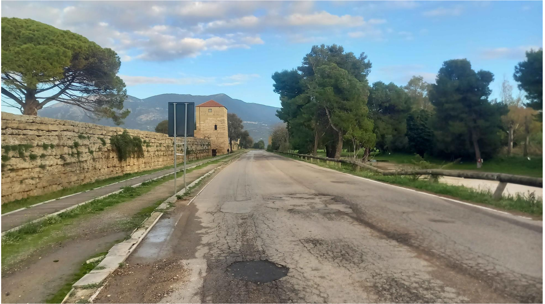
Foto 2: Vista dal lato ovest di via Porta Giustizia (foto-inserimento Stato di progetto)