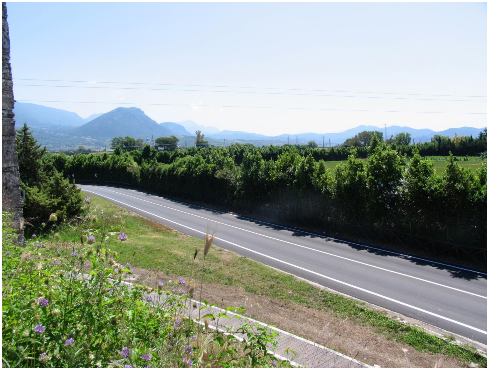
Foto 7: Vista dal lato ovest di via Porta Giustizia, sul piano superiore della cinta muraria della Torre 28 (stato di fatto)