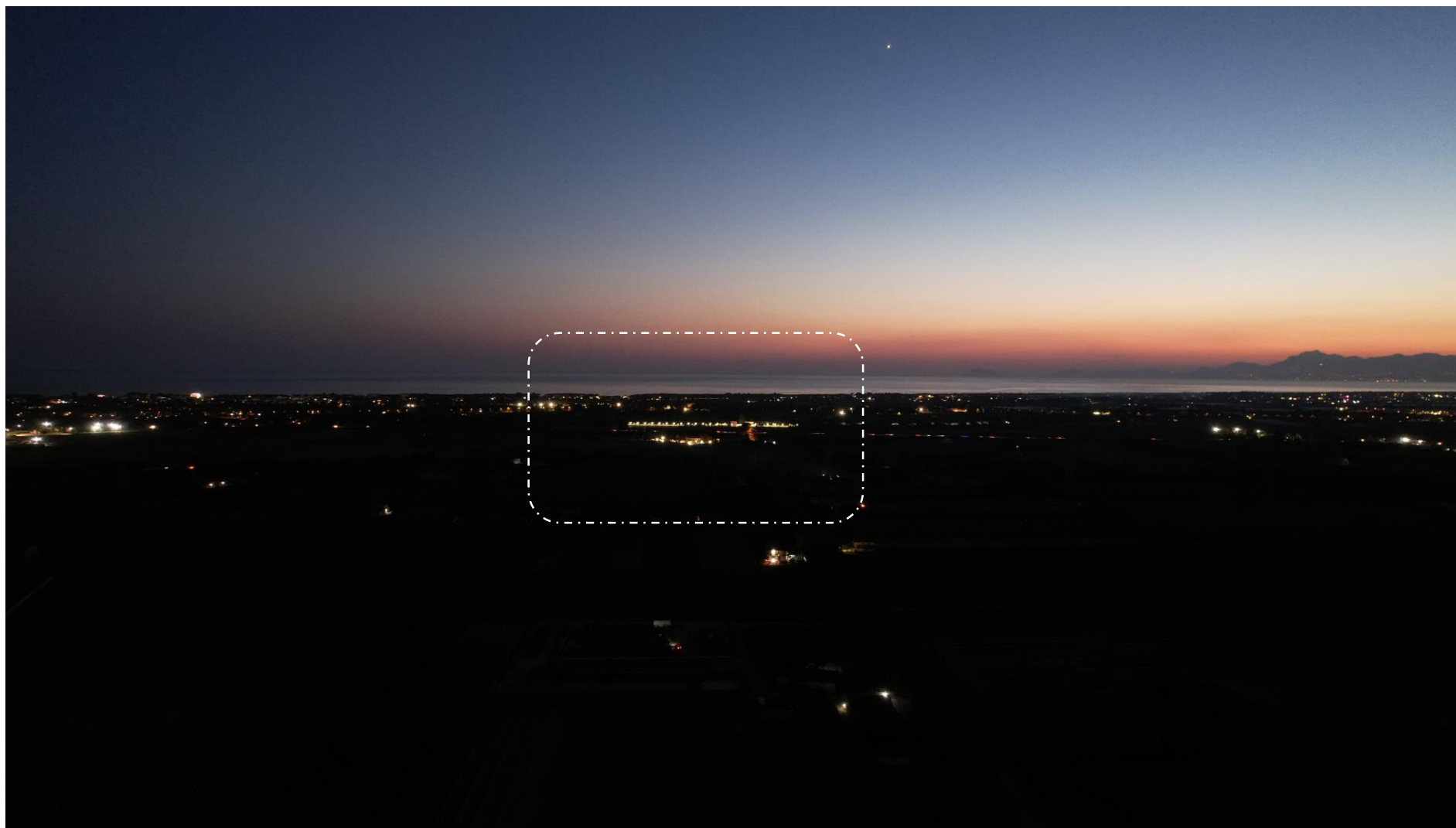
Foto 9: Vista a volo d'uccello altitudine 108m in località Chiorbo (stato di fatto)