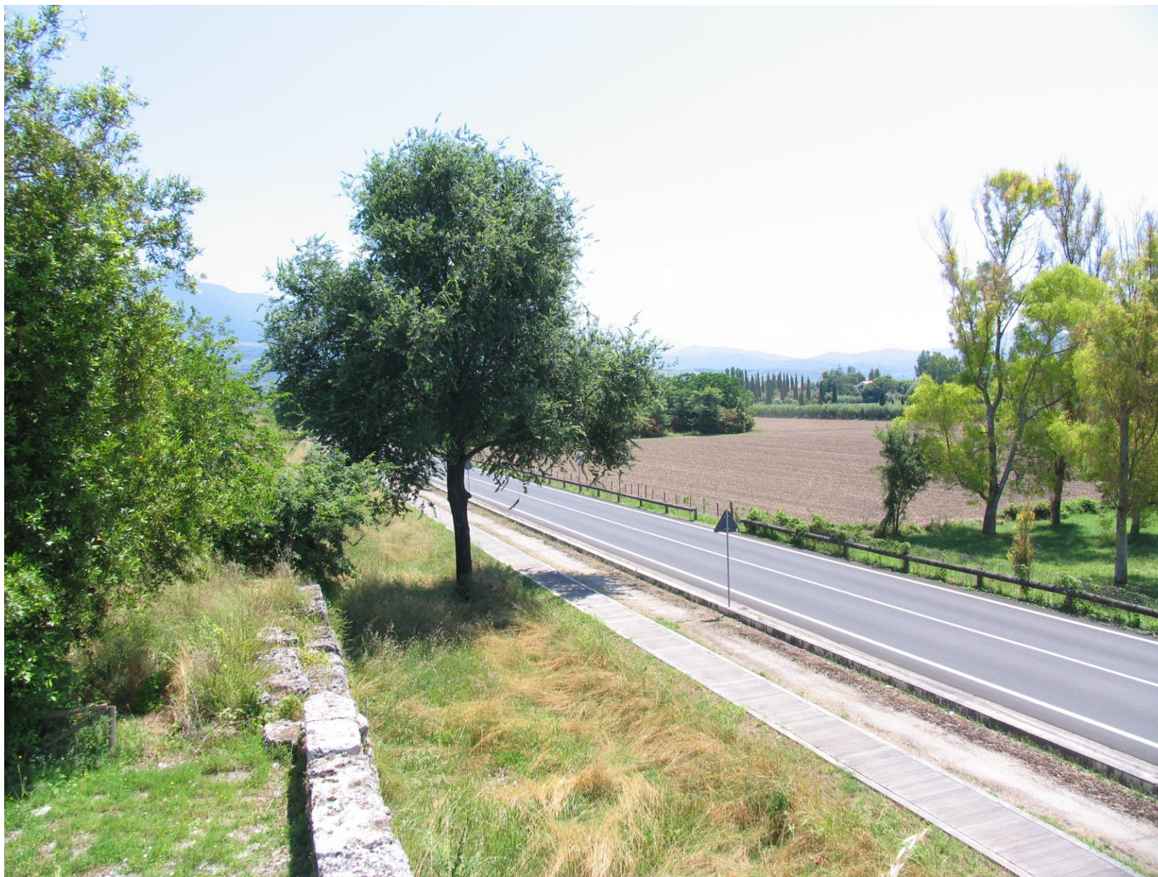
Foto 6: Vista dal lato ovest di via Porta Giustizia, sul piano superiore della cinta muraria della Torre 27 (l'intervento a farsi non modifica la veduta)