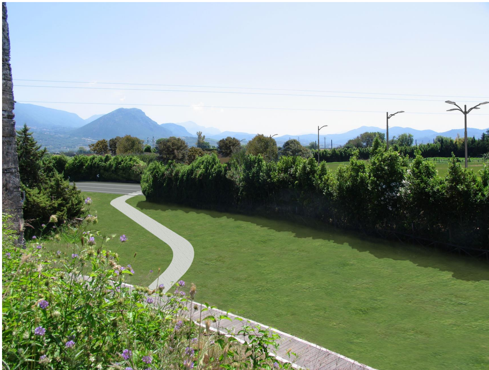
Foto 7: Vista dal lato ovest di via Porta Giustizia, sul piano superiore della cinta muraria della Torre 28 (foto-inserimento stato di progetto)