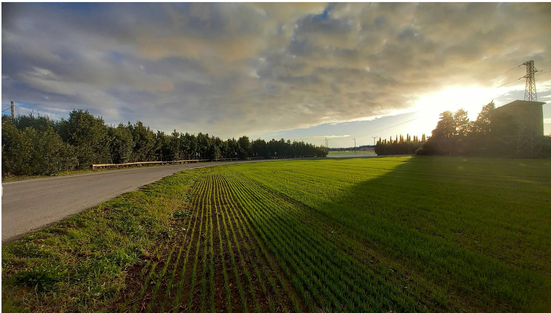
Foto 5: Vista dal lato nord di via Porta Giustizia (foto-inserimento Stato di progetto)