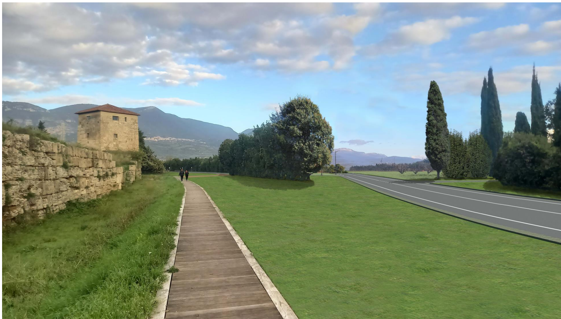
Foto 4: Vista dal lato ovest di via Porta Giustizia, in prossimità della Torre 28 (foto-inserimento Stato di progetto)