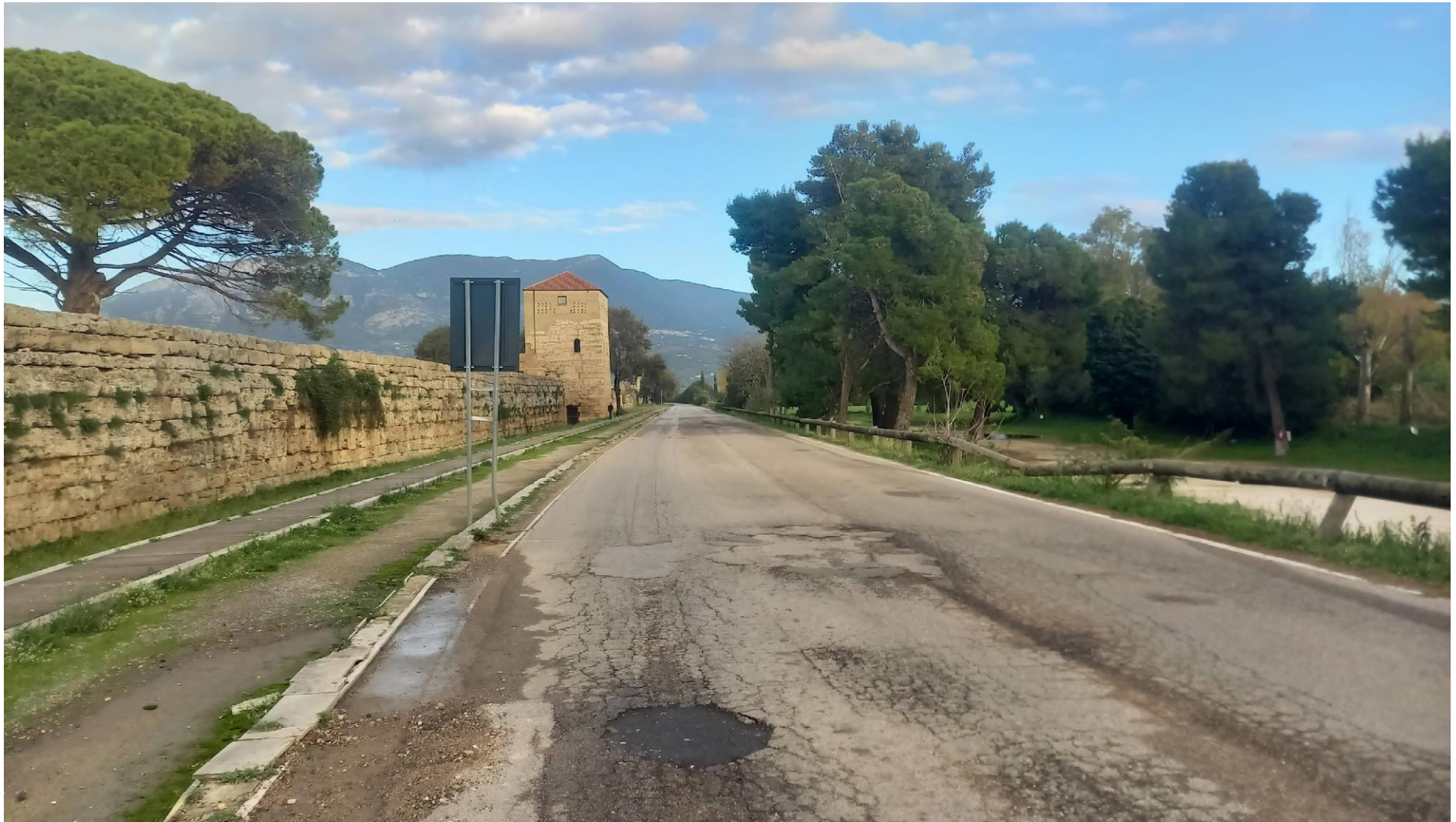
Foto 2: Vista dal lato ovest di via Porta Giustizia (Stato di fatto)