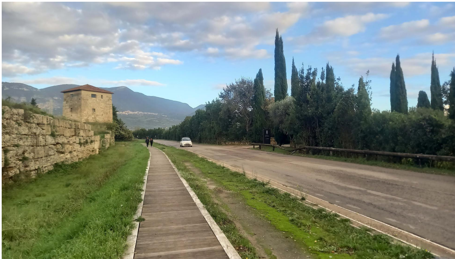
Foto 4: Vista dal lato ovest di via Porta Giustizia, in prossimità della Torre 28 (Stato di fatto)