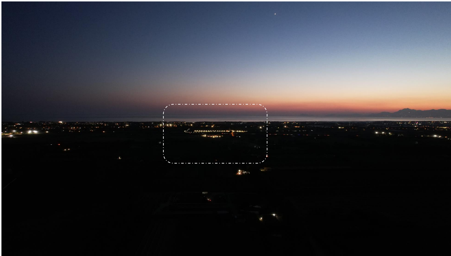
Foto 9: Vista a volo d'uccello altitudine 108m in località Chiorbo (stato di progetto)