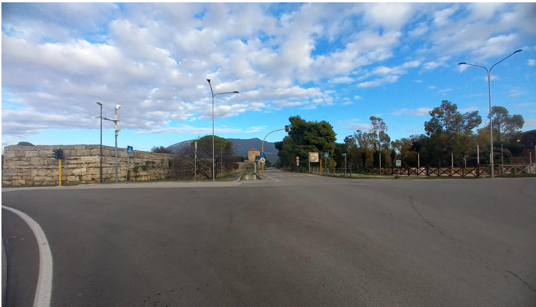
Foto 1: Vista dall'incrocio di via Porta Giustizia con via Magna Graecia (l'intervento a farsi non modifica la veduta)