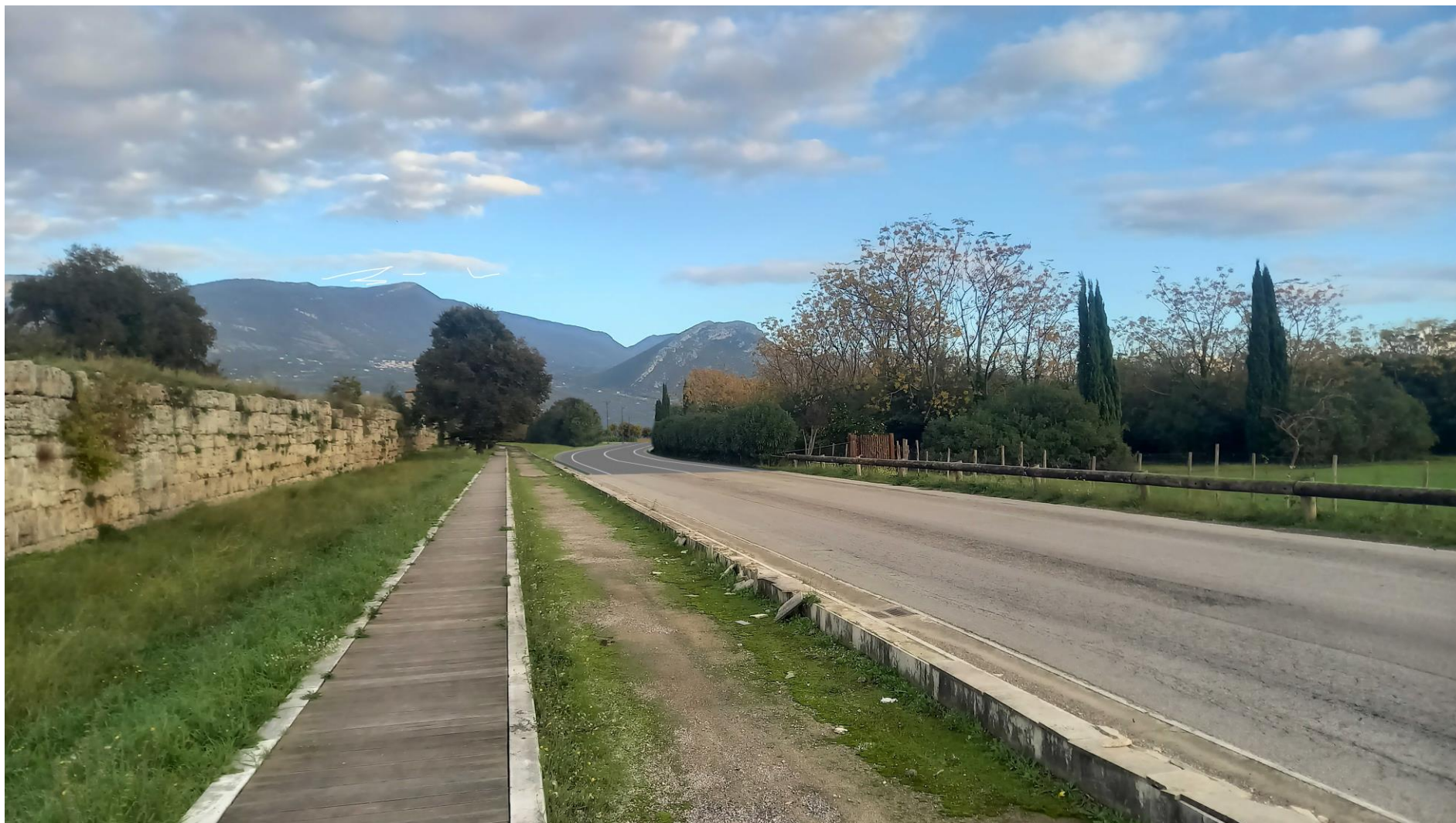
Foto 3: Vista dal lato ovest di via Porta Giustizia (foto-inserimento Stato di progetto)